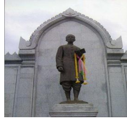
พระยาศรีสุนทร