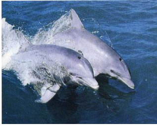
แม่น้ำบางปะกงแหล่งชีวิต