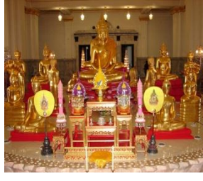
พระศักดิ์สิทธิ์หลวงพ่อโสธร