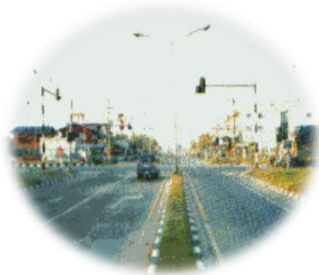
ภาพเส้นทางรถยนต์ในจังหวัดฉะเชิงเทรา

การคมนาคม หมายถึงการเดินทางไปมาติดต่อทั้งการสื่อสาร และการขนส่งสินค้า จังหวัดฉะเชิงเทราสามารถแบ่งการคมนาคมออกเป็น การคมนาคมทางบก เป็นการเดินทางไปมาติดต่อค้าขายโดยใช้ถนนเป็นเส้นทางการคมนาคมและใช้ยานพาหนะ รถยนต์ รถจักรยานยนต์ รถบรรทุก รถไฟ ในการเดินทางติดต่อ ในจังหวัดฉะเชิงเทราสามารถเดินทางติดต่อทางบกได้ 2 ทางคือ