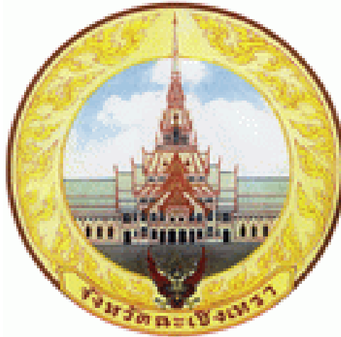
ตราประจำจังหวัดฉะเชิงเทรา

เป็นรูปโบสถ์วัดโสธรวรารามวรวิหาร ความหมายคือ เป็นจุดศูนย์รวมของประชาชนชาวจังหวัดฉะเชิงเทราให้เป็นหนึ่งเดียวกัน